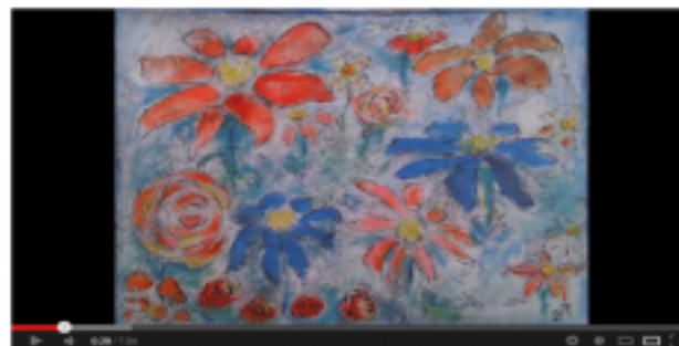
Tegne og Maleterapi - workshop fleksiba.dk/male

Du bliver vejledt og guidet, inden du overhovedet sætter pennen til papiret. Det handler om at løsne op, give slip og være fri.