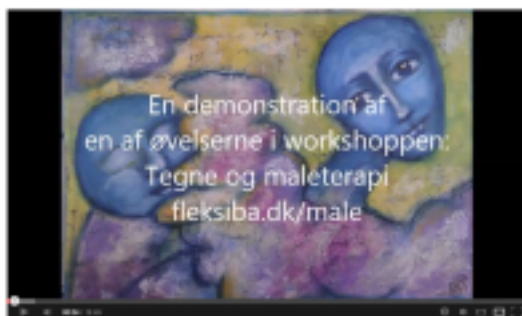
Algot: Tegne og Maleterapi - Workshop fleksiba.dk/male

Klik her for at se eksempler på teknikker i nogle af mine videoer, der ligger på youtube